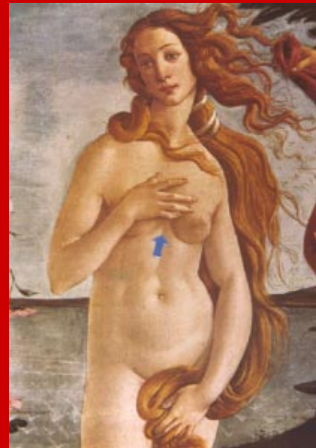
"El nacimiento de Venus". Se observan rasgos de AR en las manos. (Ver detalle página interior)