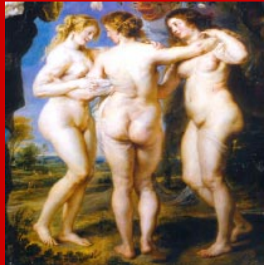
Las tres Gracias. De Pedro Pablo Rubens. Se aprecia deformidad en la mano de una de las mujeres de la pintura. (Ver detalle página interior)