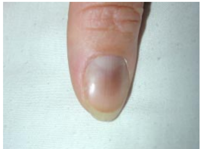
Figura 4. Pigmentación de la uña por uso de cloroquina en una paciente con AR.