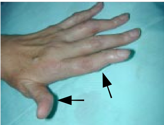
Figura 2. Nódulos en las manos de una paciente con Artritis reumatoide, secundario al uso de metotrexate por largo tiempo. (Flechas).