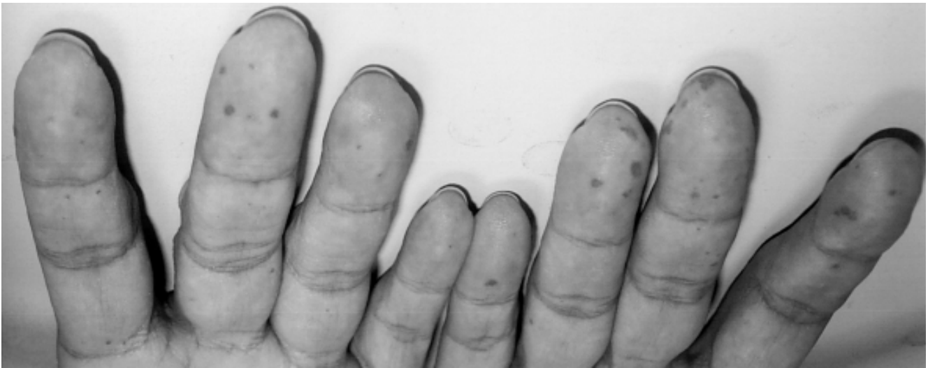
Figura 1. Manos con múltiples telangiectasias