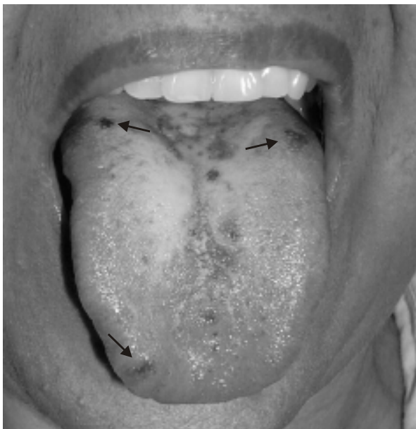
Figura 2. Telangiectasias en lengua (flechas)

albúmina de 3,23, alfa 1 globulina de 0,28, alfa 2 globulina de 0,76, beta 1 de 0,84 y gama de 1,59. Anticuerpos antimúsculo liso positivos en una dilución de 1/40. Proteína C reactiva semicuantitativa 1/8. Se le realizó una RM cerebral con gadolinio, en donde se evidenciaron datos de secuelas de evento isquémico, probablemente de origen trombótico, en el territorio de la arteria cerebral media izquierda.